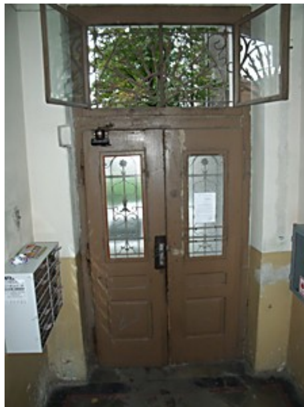
Drzwi wejściowe – widok z zewnątrz i od wewnątrz budynku