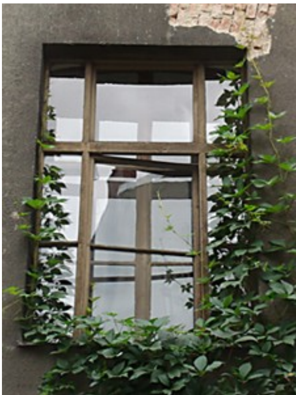
Okno nr 1