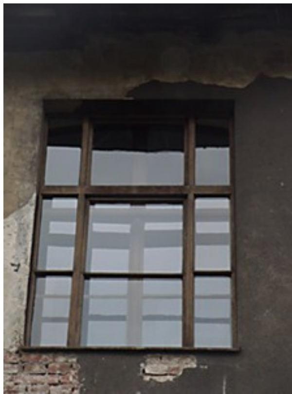
Okno nr 2