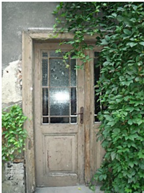
Drzwi od strony podwórka – widok od wewnątrz i z zewnątrz budynku