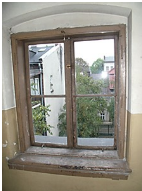
Okno nr 3